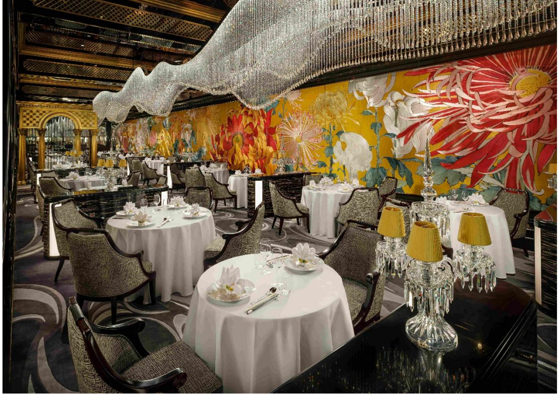
澳門上葡京綜合度假村的御花園再度摘得「最佳卓越大獎」。