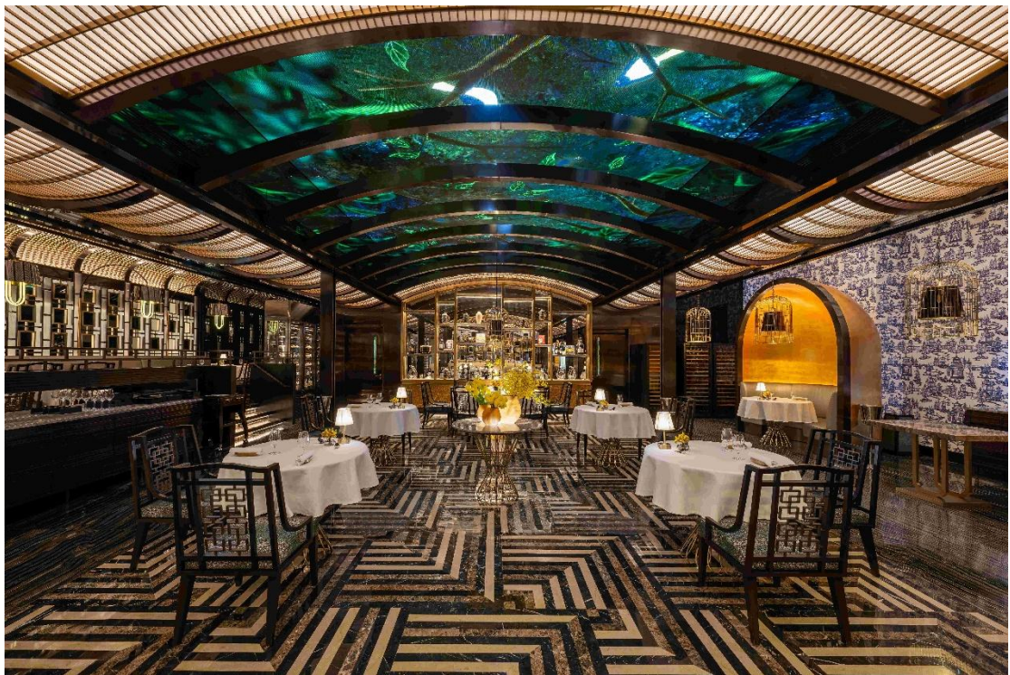
澳門上葡京綜合度假村的味賞再度摘得「最佳卓越大獎」。