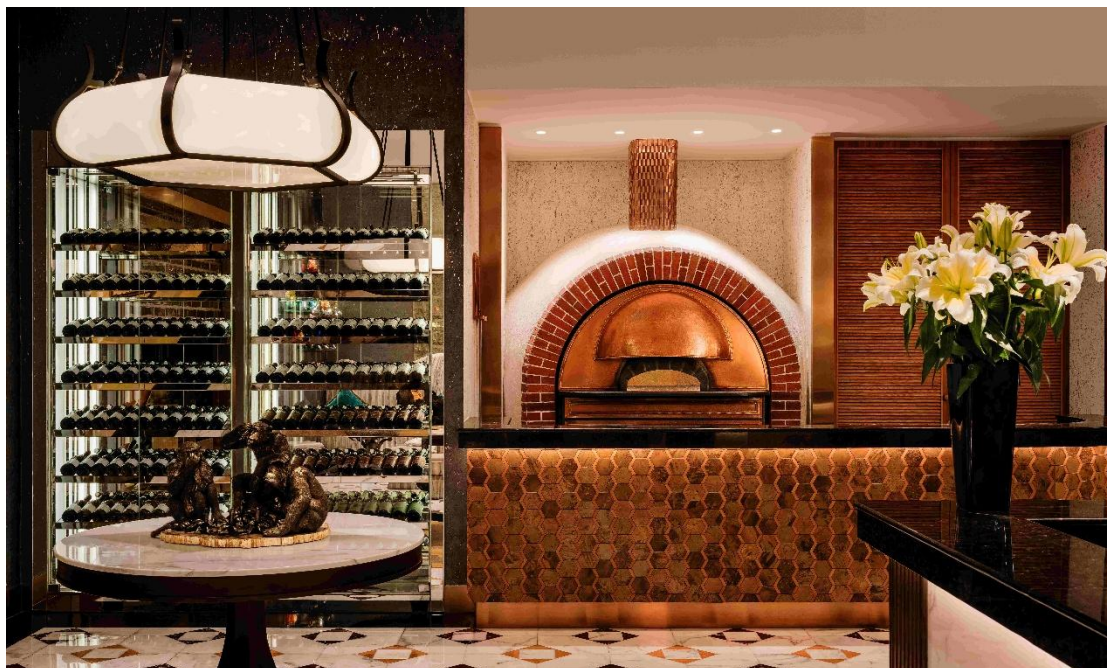
澳門新葡京酒店旗下殿堂級食府——當奧豐素意式料理，連續第 17 年榮獲「榮譽大獎」。