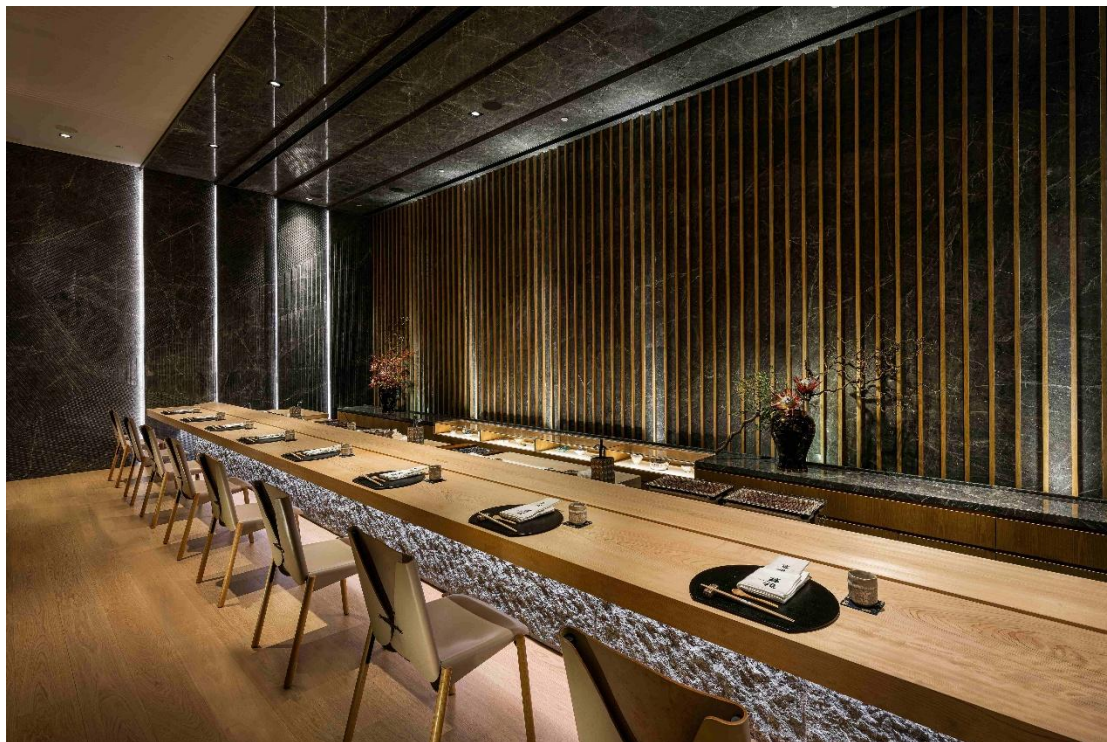
澳門上葡京綜合度假村的瑞兆再度摘得「最佳卓越大獎」。