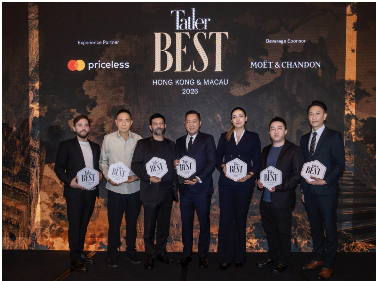
澳娛綜合憑藉優秀餐飲表現，榮膺八項《香港及澳門 Tatler Best》大獎。