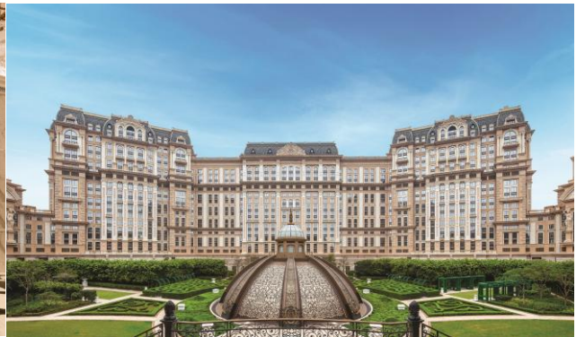
澳門上葡京建築設計巧妙糅合中西風韻，呈獻奢華住宿、多元美饌及尊尚休閒的頂級度假體驗。