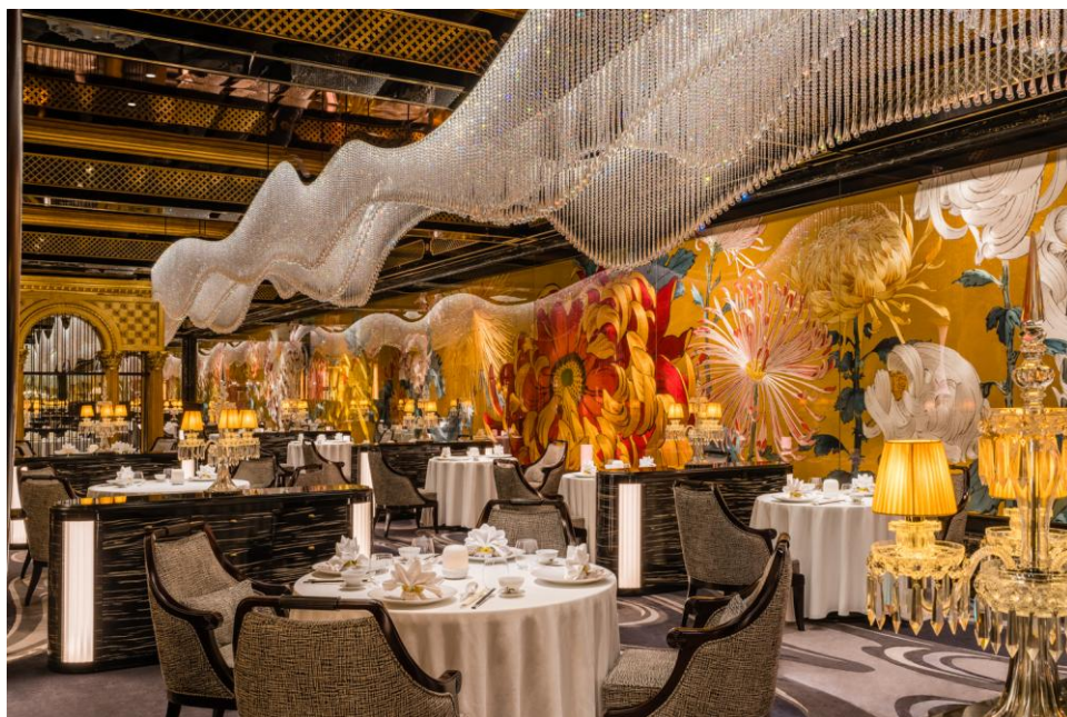
御花園於宮廷園林意境中呈現奢華粵饌，優雅展現深厚飲食文化。