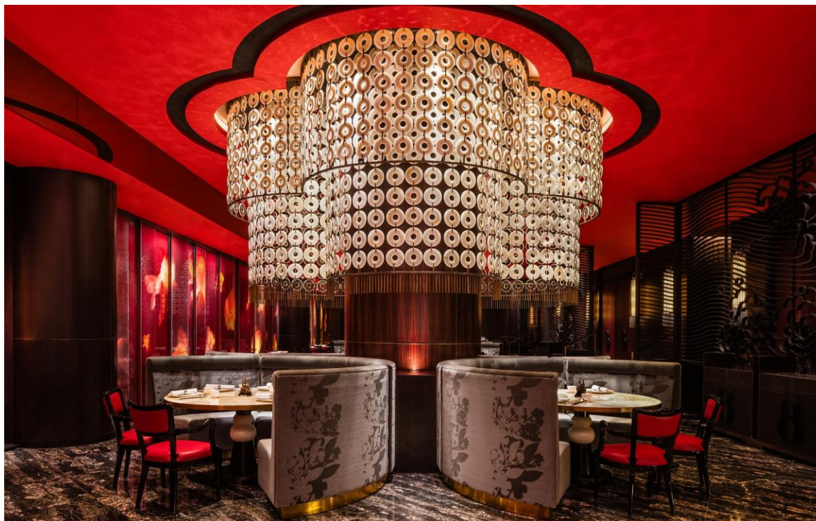
8 餐廳呈獻名貴新派廣東菜及精緻點心，為饕客締造非凡美饌體驗。