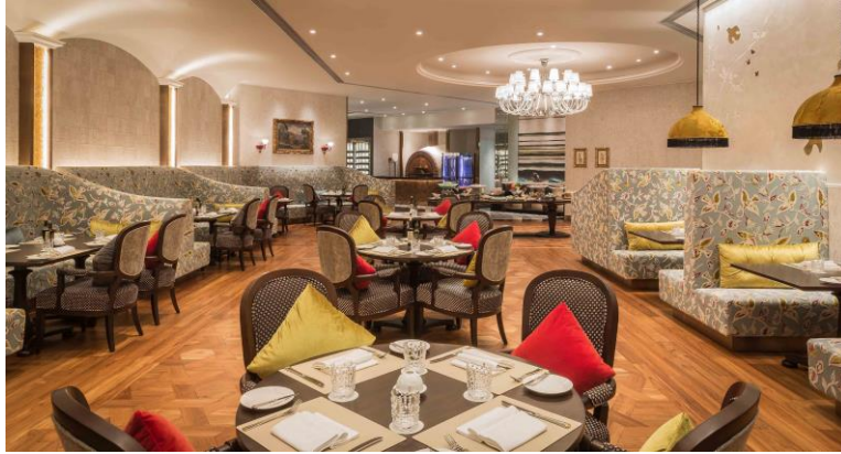
當奧豐素 1890 意式料理獲頒榮譽大獎