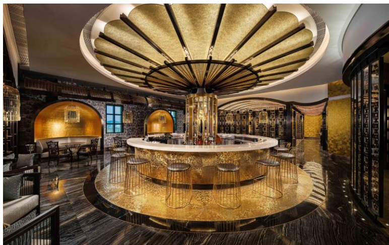
味賞獲頒最佳卓越大獎