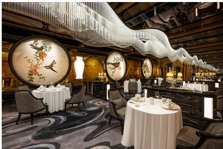
御花園獲頒最佳卓越大獎