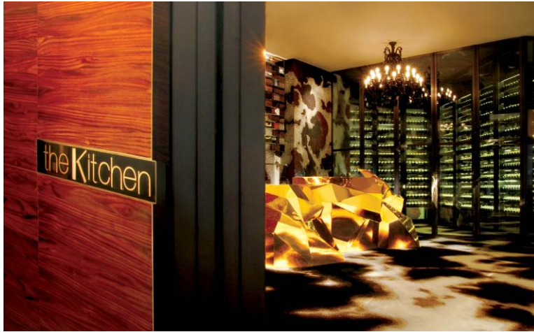
大廚獲頒最佳卓越大獎